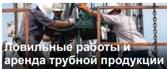
Ловильные работы и аренда трубной продукции